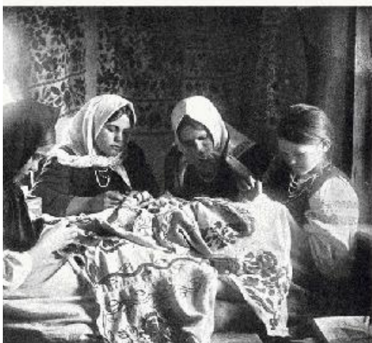
Всю семью одевали.