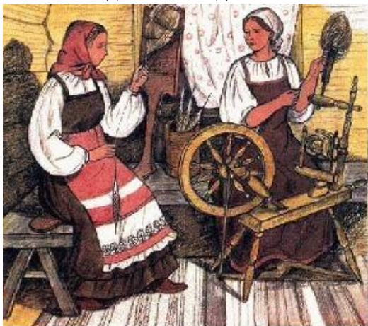
Пряли да ткали,

Существует и народная поговорка «Каков покров – такова и зима». В быту день Покрова увязывают со снежным покровом, с окончанием сельских работ, с наступлением холодов и снегопадами. Этот день означал окончание сельскохозяйственных работ. Начинался сезон посиделок и свадеб.